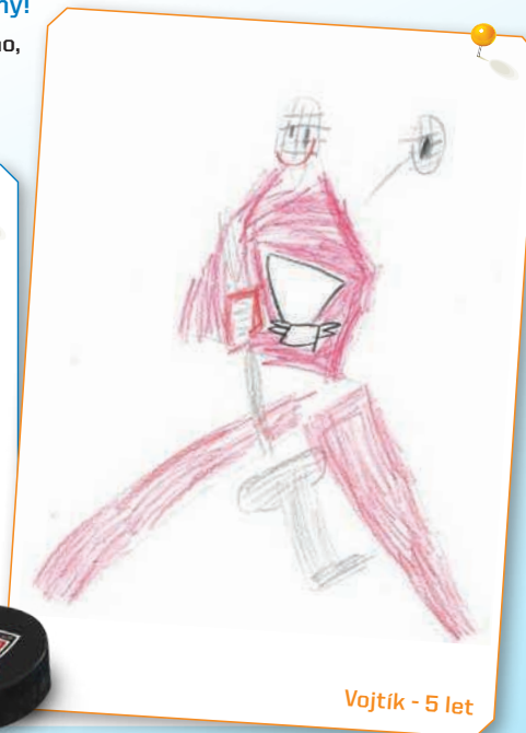
Vojtík - 5 let

Puk s podpisem hráče vyhrávají Adrianka a Vojtík