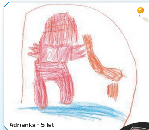
Adrianka - 5 let